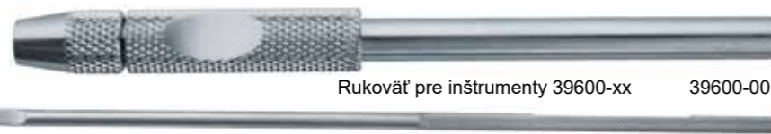
Rukoväť pre inštrumenty 39600-xx 39600-00